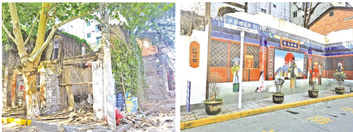
（老城街道纱帽石街创文前后对比。）

“以前，两边的房屋老旧加之车辆乱停乱放，使原本并不宽敞的街道更显拥挤。墙面破败，时不时还有人乱贴乱画；路面脏