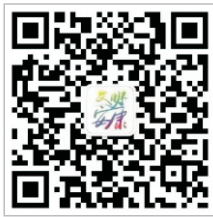
扫一扫关注微信公众号